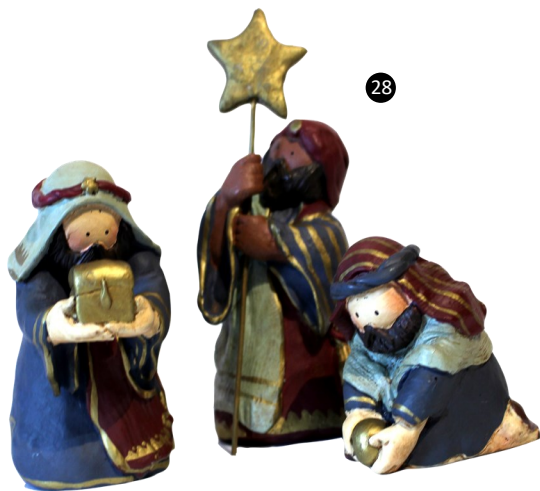
28. Holanda. Resina policromada. Autora: Anne Kabouke.