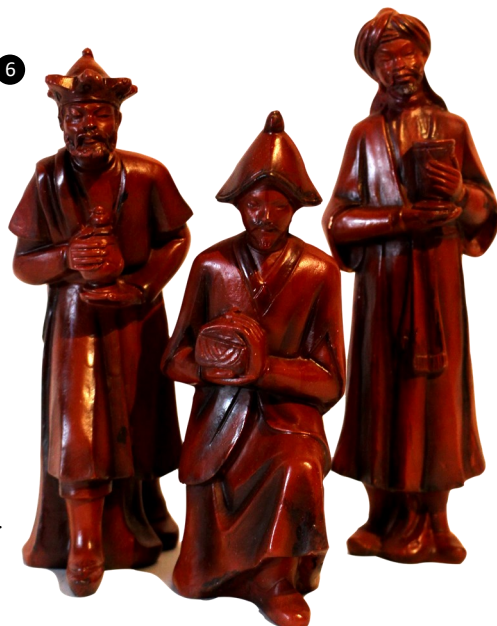
6. Murcia, España. Yeso pintado. Autor: Ortigas.