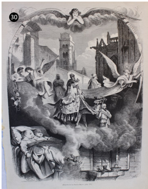
30. España. La ilustración española y americana. La noche de reyes. Año 1872.