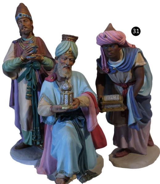
31. Barcelona. España. Barro policromado. Autor: Familia Castells.