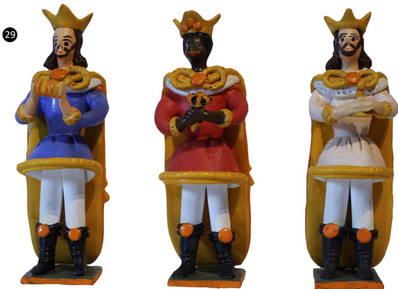
29. Estremoz. Portugal. Barro policromado. Autoras: Hermanas Flores.