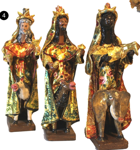
4. Cuzco, Perú. Papel maché. Autores: Familia Mendivi.