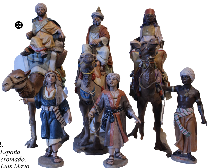
32. Madrid. España. Barro policromado. Autor: José Luis Mayo.