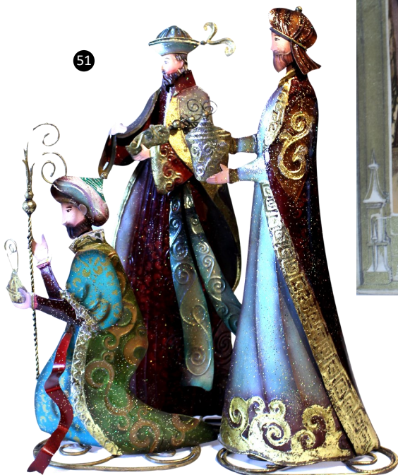
51. Londres. Inglaterra. La epifanía. Libro carrusel. Autor: Ilustraciones R.T. Cowern.