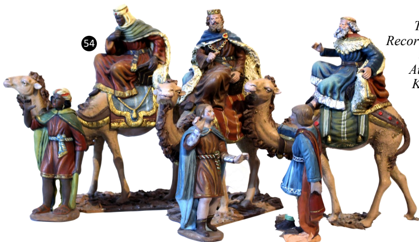
54. Tirol. Austria. Recortable la adoración de los reyes. Autor: Heinrich Kluibenscheld.