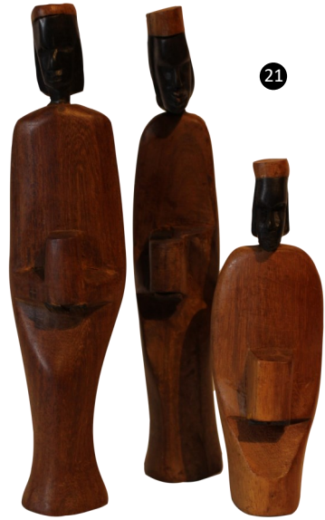
21. Tanzania. Madera de Betlem y Ébano.