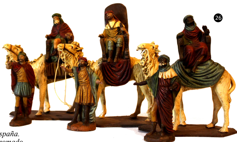
26. Murcia. España. Barro policromado. Autor: M. Ortigas.