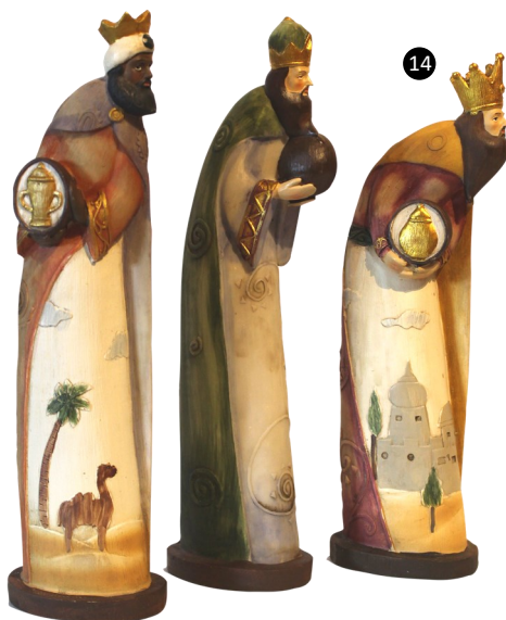
14. Holanda. Resina policromada.