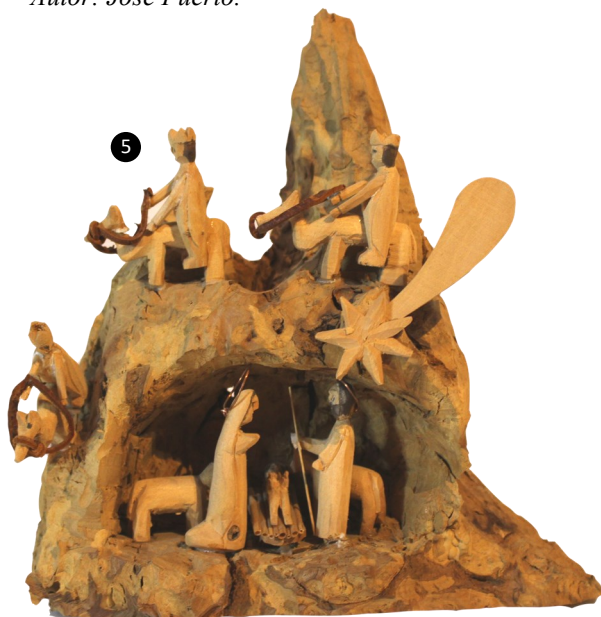
5. Portugal. Madera de olivo tallada. Autor: José Matos.