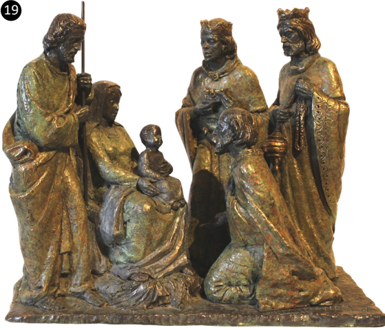
19. Zaragoza. España. Epifanía en Bronce. Autor: Luis Martínez Lafuente.