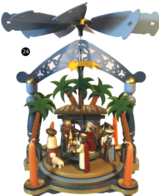
23. Indonesia. Madera policromada.