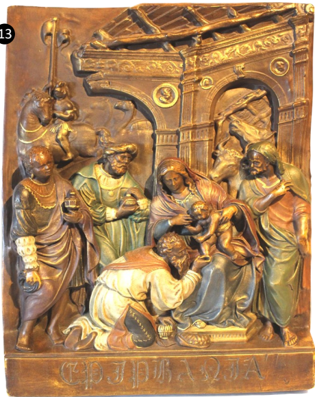
13. España. Epifanía. Relieve en pasta de madera.