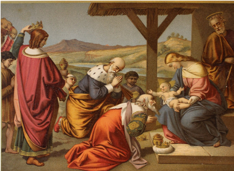
20. Barcelona. España. Epifanía. Grabado cromolito grafiado. Autor: Vicente De La Fuente. Siglo XIX.