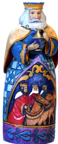
39. Estados Unidos. Resina policromada. Autor: Jim Shore.