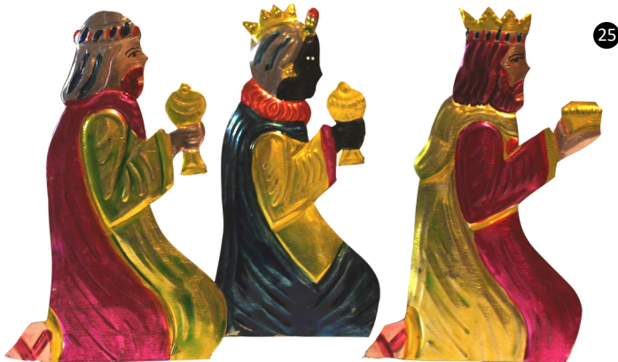
25. México. Hojalata tintada.