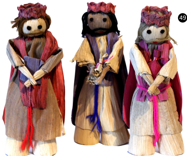
49. El Salvador. Tusa hoja de maíz.