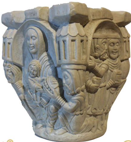
45. España. Reproducción de capitel románico. Piedra artificial.