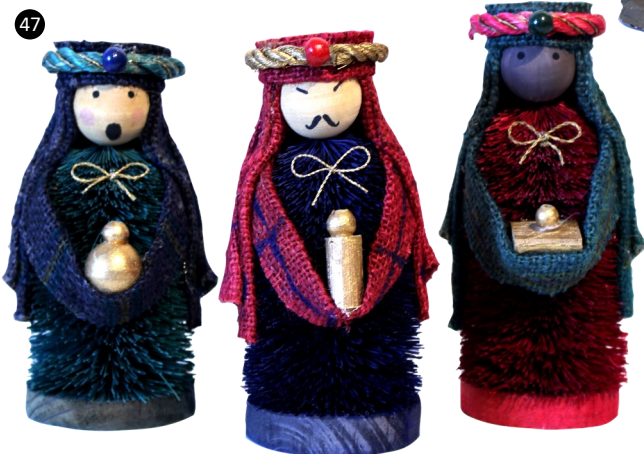
47. Filipinas. Fibras naturales.