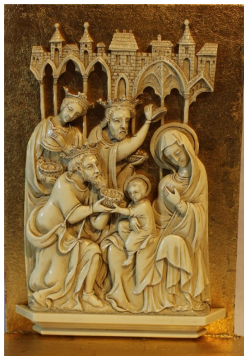
3. España. Adoración de los magos. Marfilina moldeada. Autor: José Puerto.