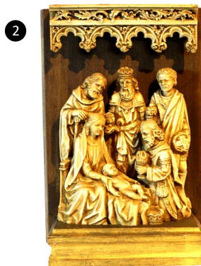
2. Salamanca. España. Marmolina moldeada. Autor: Orejudo.