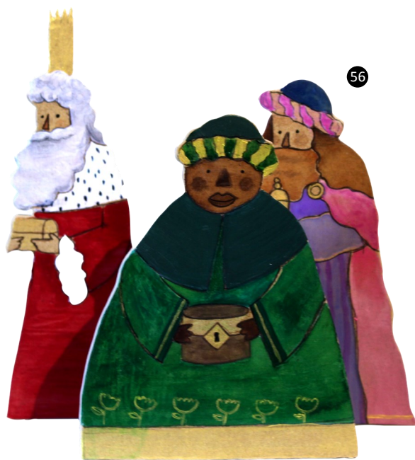
56. Murcia. España. Reyes pintados sobre madera troquelada. Autora: Marta Boza.