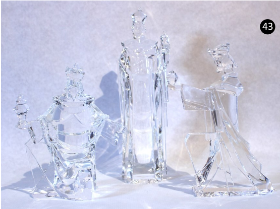
43. China. Metacrilato moldeado.