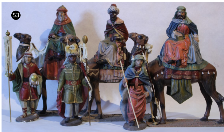
53. Murcia. España. Barro policromado. Autor: M. Nicolás Almansa.