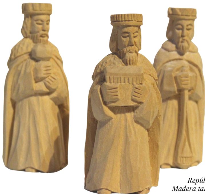
15. República Checa. Madera tallada en su color.