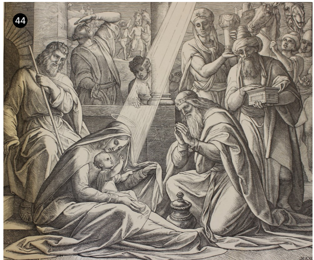
44. París. Francia. Ilustraciones de la biblia. Autor: Jules Schnorr de Carolsfeld.