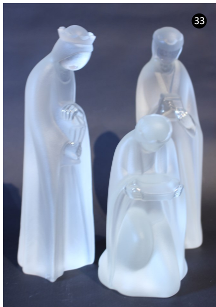
33. Alemania. Cristal de roca. Autor: Clas Kunst.