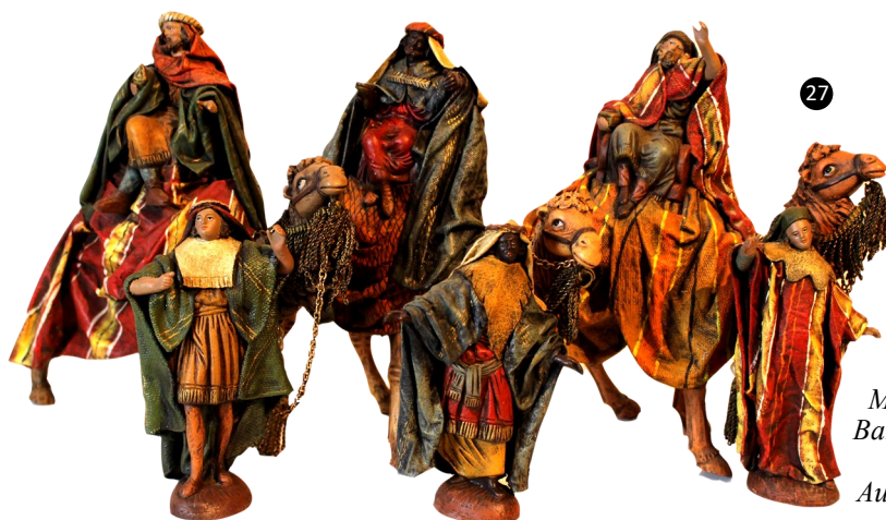
27. Murcia. España. Barro policromado y enlizado. Autor: M. Ortigas.