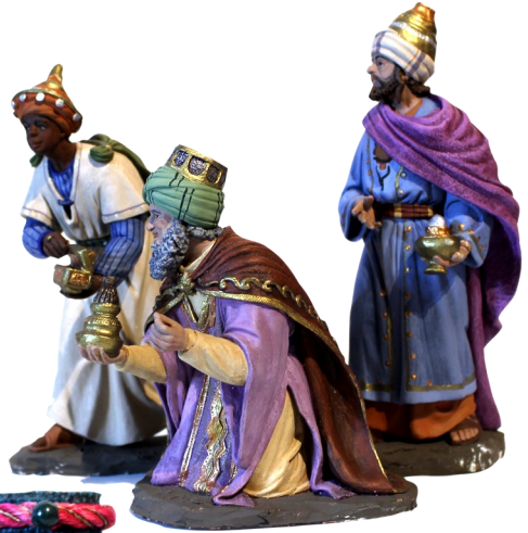
46. Jerez. España. Pasta cerámica policromada. Autor: José Joaquín Pérez.