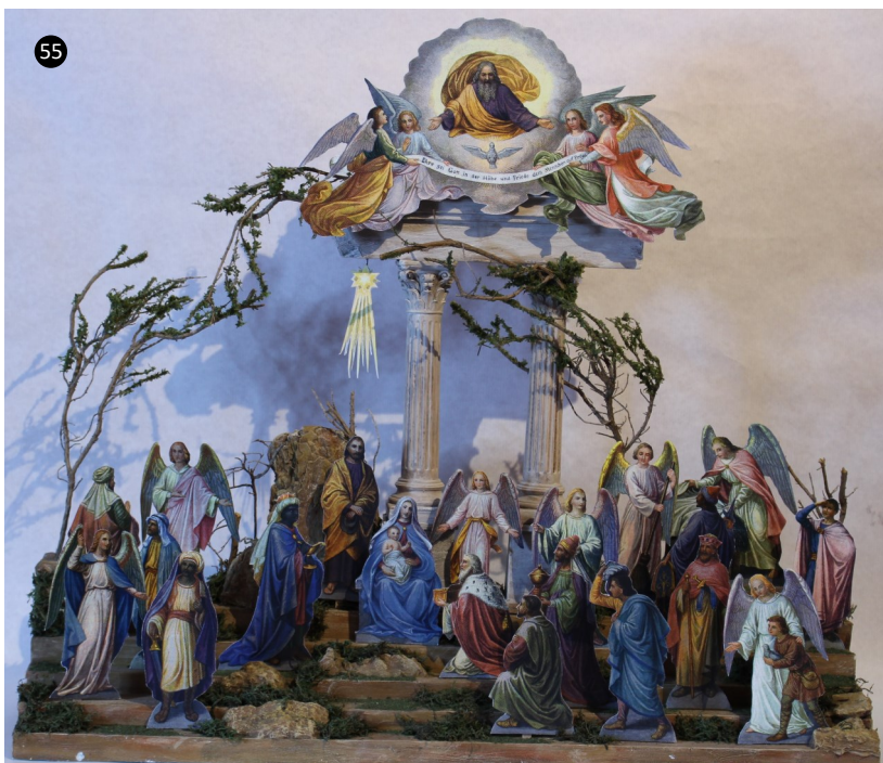
55. Murcia. España. Barro policromado. Autor: Carlos Cuenca.