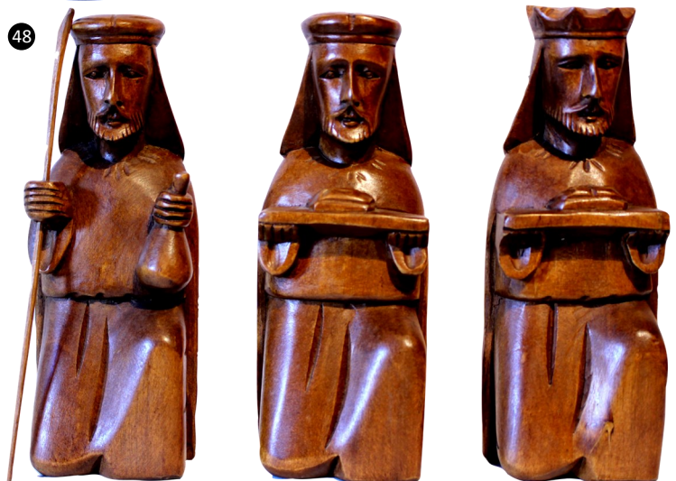
48. Filipinas. Madera tallada en su color.